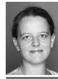
Prof. Dr. Isabel Schnabel FB 03: Lehrstuhl für Financial Economics